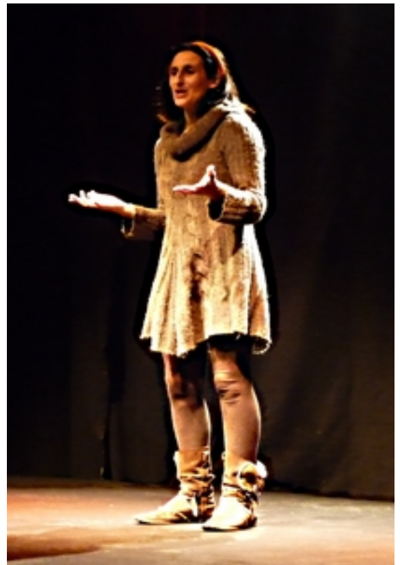
Journées professionnelles Festival de la Nied (57) 2004

Proposition conçue à l'origine pour le Conseil Général des Vosges pour l'ensemble des assistantes maternelles à domicile.