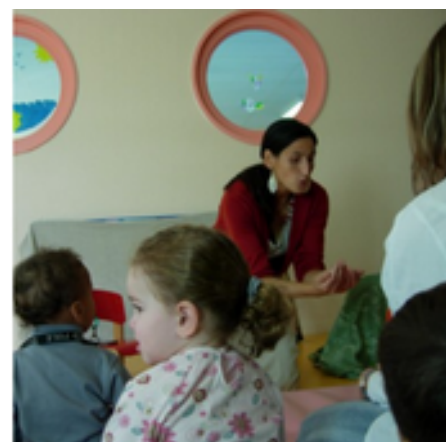
Crèche d' Ukange (57) 2005