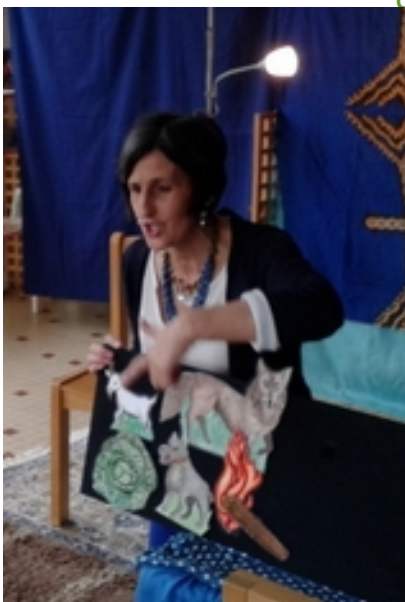
Bib. St Céré sur Lot (46) Fév 2016