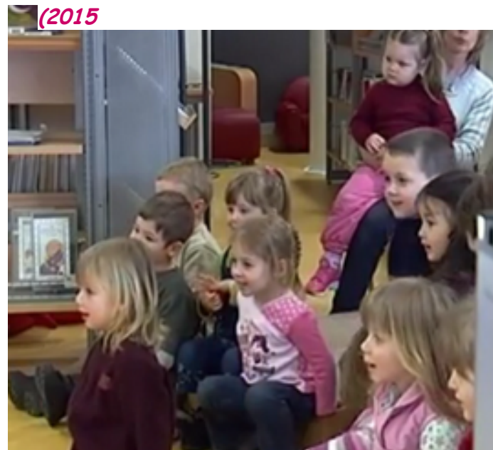
Reportage par une télé locale à la Bibliothèque de Maizières-lès-Metz (57) 2005