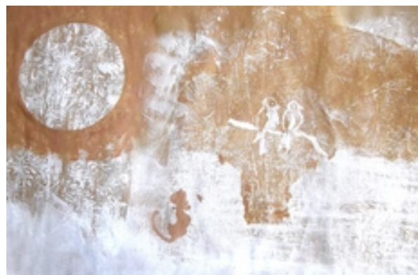
Pochoirs et impressions