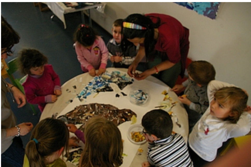
Collage géant d'après les histoires entendues Frouard (54) 2008