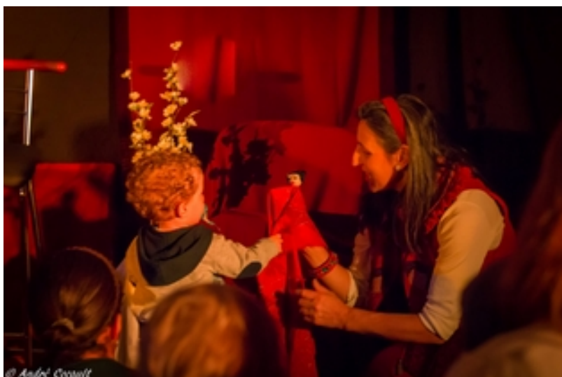
Festival Montberon (31) Mars 2018