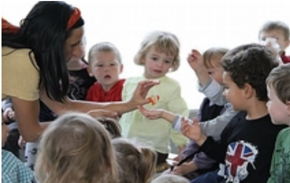
Festival de la Nied (Moselle) - 2000