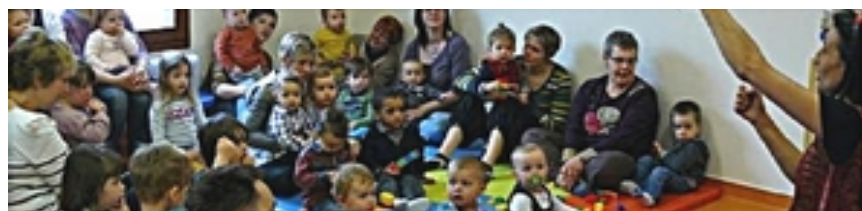
Crèche des P'tits Loups Rambervillers (88) 2011