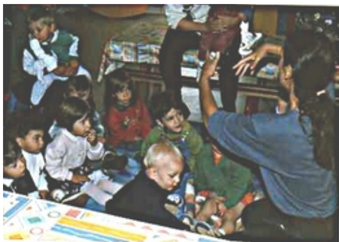
H. garderie La Farandole Favières (54) 1997