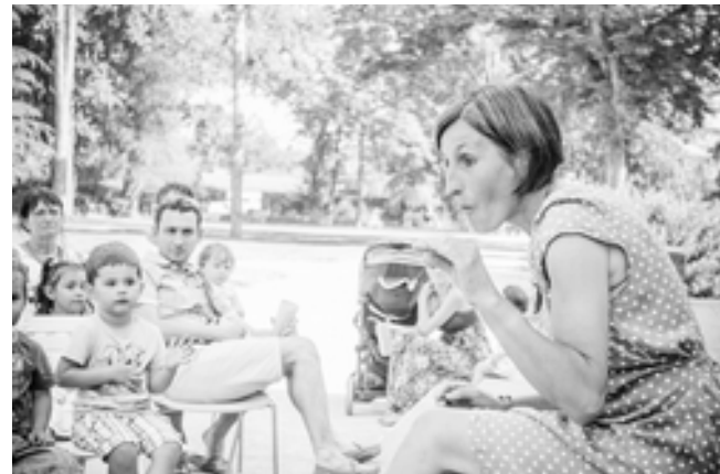
20 ans de la Crèche Lou Pitchon Gaillac (2015)

Pour la qualité de l'échange, un petit groupe est souhaitable.