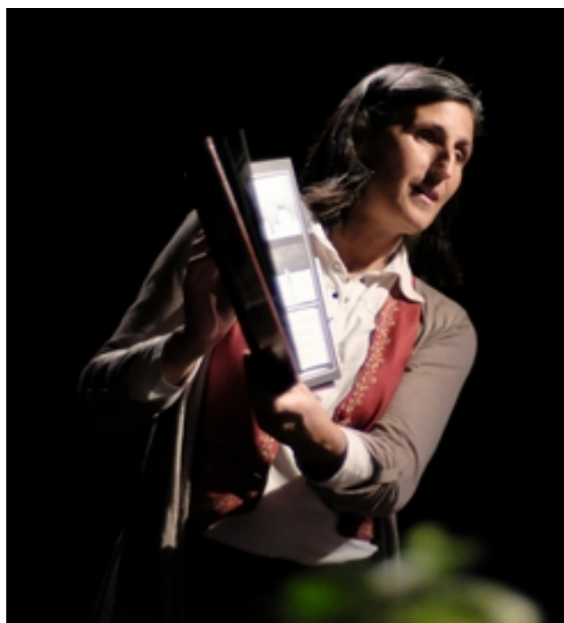
Festival Tout Conte Fées Cordes (81) 2016