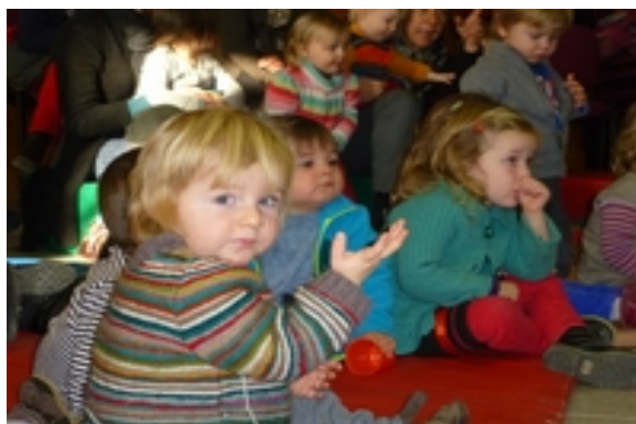
Les Coccinelles Cordes-sur-ciel (81) Noël 2012

Je désire vivement aider ce lien parent/enfant par ma sensibilité de conteuse car je crois que le métier de parent est le plus important au monde et pourtant, il n'y a pour lui aucune formation !